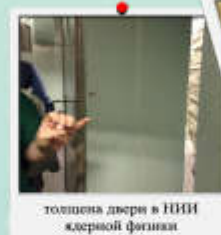
толщина двери в НИИ ядерной физики