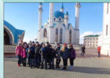
учащиеся 6 «А» класса

Одним из таких стал Раифский Богородицкий монастырь, где воспитываются мальчики из неблагополучных семей и детских домов. В свободное время мы провели в аквапарке Казани – Ривьере, там нас ожидала масса положительных эмоций и приятных минут.