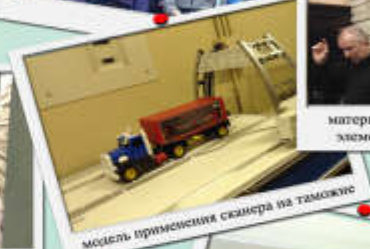
модель применения сканера на таможне