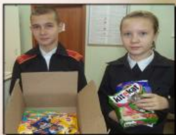
Проведение акции Помощи животным