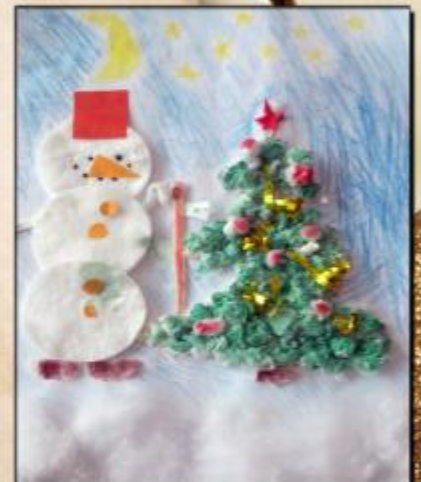
Астапенко С., 1 "Д"