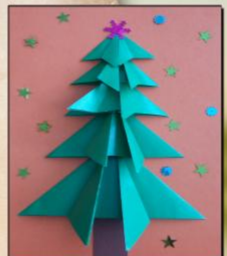
Воронков Т., 1 "Д"