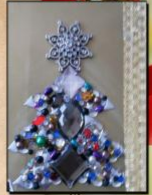
Ретьев И., 1 "Д"

http://kladraz.ru/prazdniki/novyi-god/detjam-o-prazdnike-novyi-god.html Обложка - http://www.setwalls.ru/pic/201304/2560x1600/setwalls.ru-10547.jpg Смп 1-2 - http://winallos.com/uploads/posts/2014-12/1418790202_novy-god-prazdnik-happy-new-year-novogodnie-obo-i.jpg Смп 3-4 - https://www.vash-ng.ru/wp-content/uploads/2014/11/blue5.jpg Смп 5-6 - http://www.topoboi.com/pic/201307/2560x1440/topoboi.com-3720.jpg